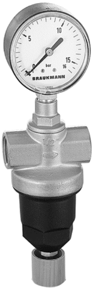
D22 – standard utførelse.