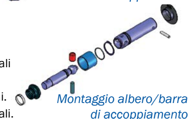
Montaggio albero/barra di accoppiamento