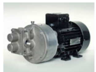
GMC2, GMC4, GMC6, GMC8, GMH6, GMH8, GM12, GM16