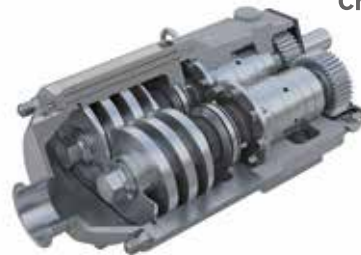
UNIVERSĀLAIS DIVU VĪTŅU SŪKNIS