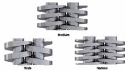
TRĪS VĪTŅU VARIANTI