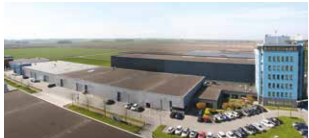
CENTRĀLĀ NOLIKTAVA, LELEISTADE, NĪDERLANDE