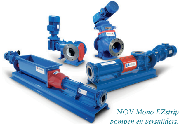
NOV Mono EZstrip pompen en versnijders.

Greenyard Frozen Belgium Westrozebeke is een internationale producent en leverancier van diepvriesgroenten en -fruit. Voor het verpompen van hun producten waren zij dringend op zoek naar een nieuwe slijbomp. Na een bezoek van een AxFlow Rayon-manager is er samen met de klant gekozen voor een nieuwe Mono EZstrip excentrische verdringerpomp. Deze pompen staan op voorraad in ons distributiecentrum, waardoor de klant de pomp dezelfde dag nog bestelde én direct geleverd kreeg. Greenyard Frozen was erg geholpen met de snelle service van AxFlow.