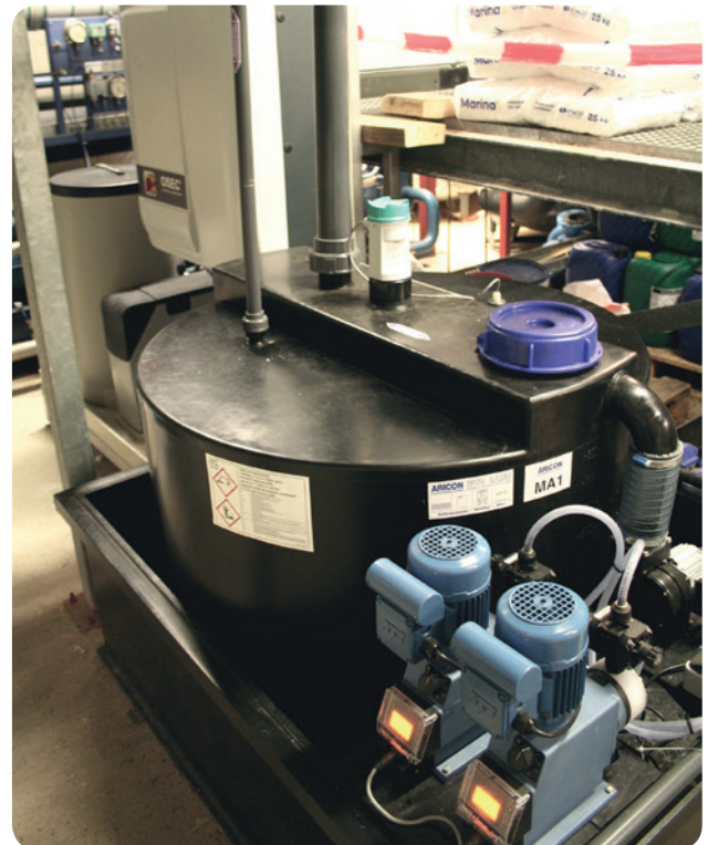
Behalve installatie van het nieuwe chloorelektrolysesysteem, voert AxFlow ook het onderhoud uit.

Het systeem werd door AxFlow op locatie geïnstalleerd. Om eventuele lekkages op te vangen, is de opslagtank in een lekbak geplaatst. Ook hier is een sensor geïnstalleerd. Indien er sprake is van een lekkage geeft deze sensor een signaal.