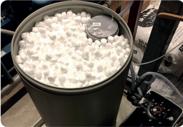
Het zoutvat gevuld met zouttabletten.