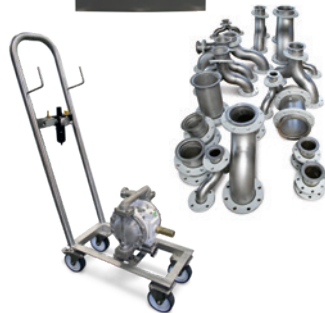
Vervaardigen van de verschillende componenten zoals het frame, de besturing en appendages.