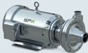
Waukesha magnetisch gekoppelde centrifugaalpomp