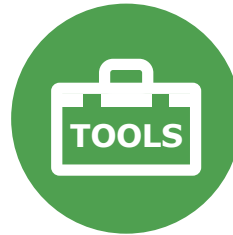
Onderhoud & reparatie