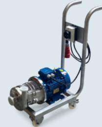
De standaard module