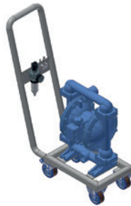
Technische 3D tekening