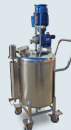
Volledig volgens klantspecificatie