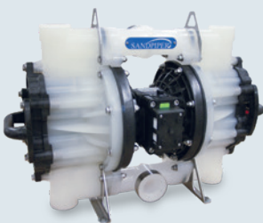
SandPiper luchtgedreven membraanpomp