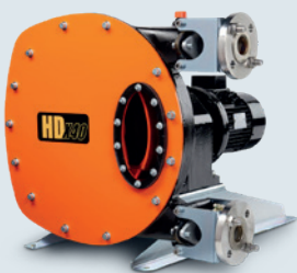
Abaque industriële slangenpomp