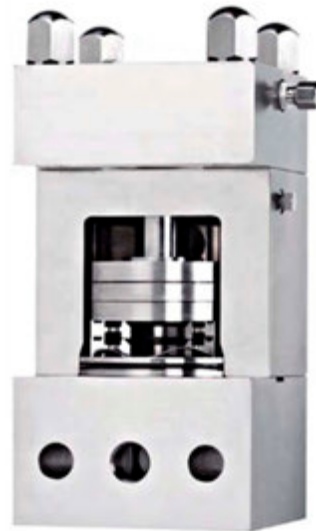
Patentierte Micro-Gap Ventil

Die Ergebnisse eines Einsatztests unter Realbedingungen zeigten, dass jährliche Einsparungen bis 15.000,- Euro möglich sind im Vergleich zu konventionellen Ventilen, die höhere Drücke benötigen.