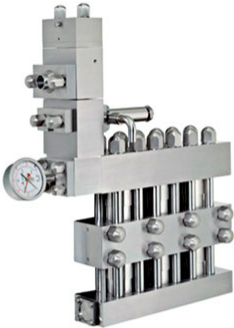
Rannie Dreiteiliger Zylinder mit Hydraulikantrieb